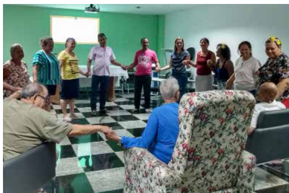
Momentos de fé e reflexão