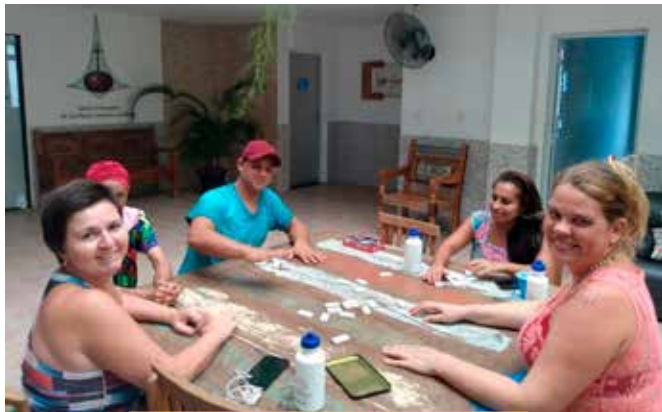
Na área interna coberta, os albergados participam de atividades coletivas e jogos cooperativos