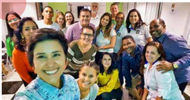
Grupo de participantes das capacitações

Esta primeira edição originou outras três capacitações exclusivas para os participantes, possibilitando um aprofundamento nos assuntos abordados. A primeira delas foi realizada ainda em 2019 e teve como tema comunicação, sendo ministrada pelo parceiro Buzz.me, reunindo 40 pessoas. Estão programadas, para 2020, formações sobre aspectos legais e voluntariado. O intuito é que o Formar em Rede continue sendo realizado com edições anuais e novos parceiros convidados.