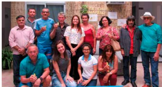
Grupo de albergados no evento Setembro Amarelo

A festa junina leva alegria e promove a integração entre as pessoas acolhidas