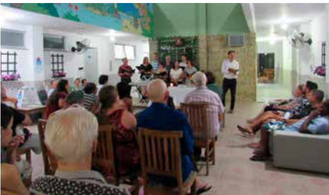
A celebração de Natal teve apresentação do Coral da IECLB de Vitória