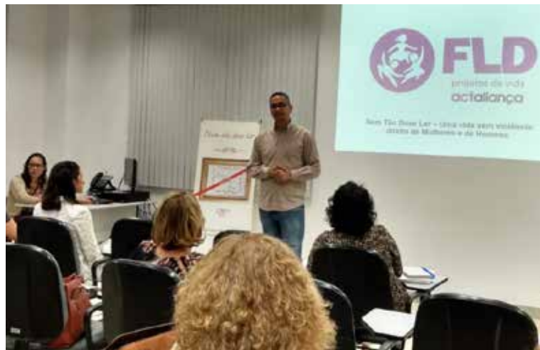
Capacitação da metodologia “Nem Tão Doce Lar” no Espírito Santo, realizada na sede do Ministério Público Estadual, em Vitória

Montando uma réplica de uma casa comum, com móveis e utensílios domésticos que dão pistas das violências cometidas nos lares, a exposição aconteceu no dia 29 de novembro, na Escola