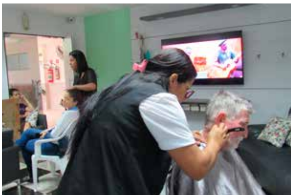
A programação do Outubro Rosa e do Novembro contou com um dia de beleza