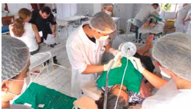
Os mutirões para detecção do câncer de pele são realizados em 11 municípios capixabas

O Programa de Assistência Dermatológica (PAD), que leva orientação e tratamento para o câncer de pele, teve a parceria da Associação Albergue Martim Lutero em 2019, por mais uma edição. O trabalho, que também tem o apoio da Igreja Evangélica de Confissão Luterana (IECLB), da Universidade Federal do Espírito Santo (Ufes), da Secretaria de Estado de Saúde do Espírito Santo (Sesa) e das prefeituras atendidas, beneficia moradores de 11 municípios do interior do Espírito Santo onde há uma prevalência da população vulnerável ao câncer de pele.