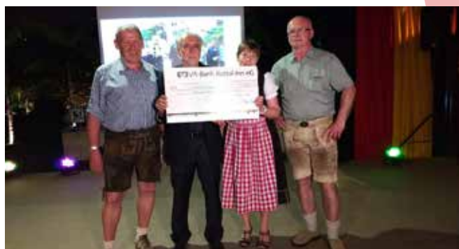
A entrega simbólica do cheque foi feita pelos representantes da comunidade alemã Evangelisch Kirsch Eggelfelden

O recurso, que foi levantado em parceria com um grupo de teatro da Igreja Católica da cidade, foi investido na implantação de energia fotovoltaica, que trará como benefícios a economia de recursos naturais e a redução de gastos com tarifa energética.