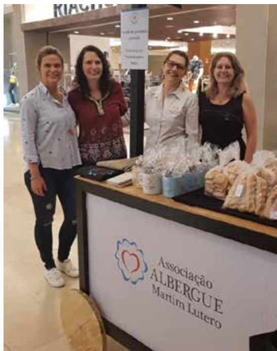
A equipe do Albergue no estande da instituição durante a I Feira da Solidariedade, realizada pelo Instituto Américo Buaiz