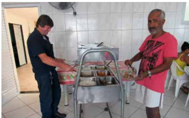
No refeitório são feitas quatro refeições diariamente, entre café da manhã, almoço, lanche da tarde e jantar