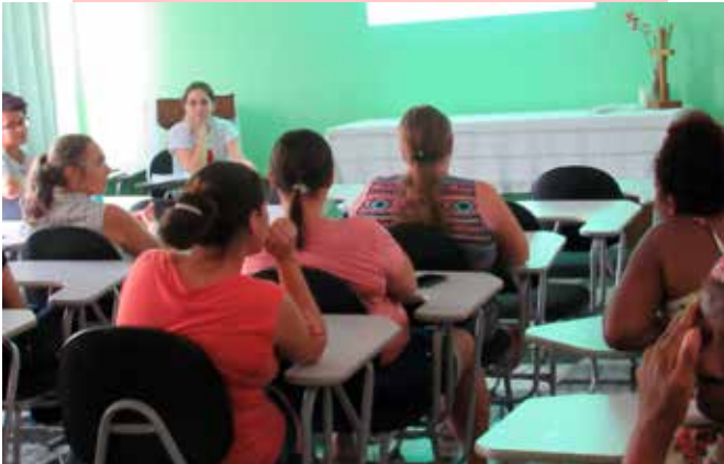
Palestra realizada para marcar o Dezembro Vermelho