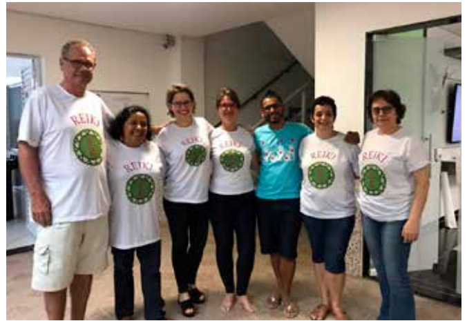
As sessões de Reiki beneficiaram albergados e funcionários