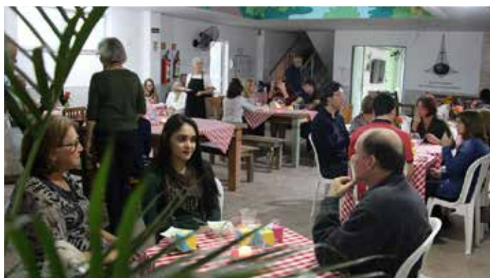
A Noite de Massas reuniu cerca de 120 convidados na sede do Albergue