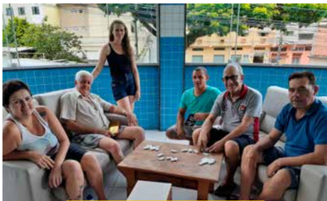
Após retornarem do tratamento nos hospitais, os albergados aproveitam o tempo para bate-papo e jogo de dama no pátio externo e no espaço de leitura