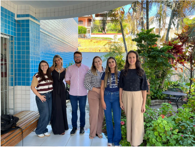
Representantes da prefeitura de Itarana ES

Os momentos contribuíram para o fortalecimento das parcerias e para a construção de estratégias conjuntas, visando a continuidade e a ampliação do atendimento oferecido.